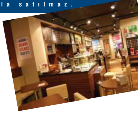
TCHIBO-Antalya KRN Mimarlık aracılığıyla üretilmektedir.