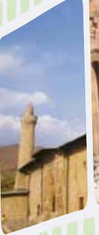
Sivas Ulu Camii