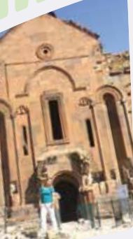
Kars Ani Harabeleri