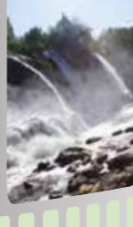
Van Muradiye Şelalesi