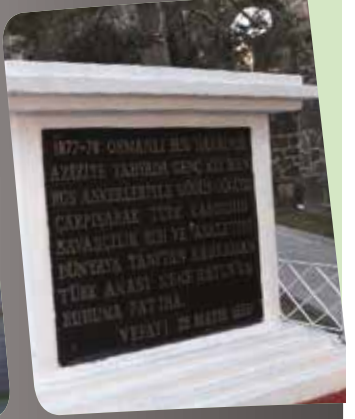
Erzurum Nene Hatun Mezarı

Turumuz daha ilk şehirden heyecan verici başladı. Bitlis'in Ahlat ilçesinde bulunan Ahlat Mezarlığı beni hayrete düşürdü. Girişteki tabelada yazan "Ahlat mezar taşları Orhun Abideleri'nin Anadolu'da yaşatılan temsilcileri niteliğindedir." cümlesi Ahlat mezarlığının önemini anlatmaya yetiyordu. 12. yy. Selçuklu dönemine ait 200 dönüme yayılmış bana göre mezarlıktan öte bir yerdi. Unesco dünya kültür mirası geçici listesinde yer alan Ahlat Mezarlığı, en kısa zamanda asıl listeye geçmeyi hak eden bir yer. İslam dünyasının en büyük mezarlığı olmasının yanı sıra, çoğu 2 metreden yüksek olan mezar taşları o döneme ait pek çok ipuçları vermektedir. Bir diğer dikkat çeken nokta ise Ahlat'ta pek çok kümbet (anıt mezar) bulunmasıdır. 13. yy.'da yapılan çifte kümbet bunlardan birisidir. Şirin Hatun Buğatay Aka Kümbeti çifte kümbetin büyük olanı, Hüseyin Timur Esen Tekin Kümbeti ise çifte kümbetin küçük olanıdır.