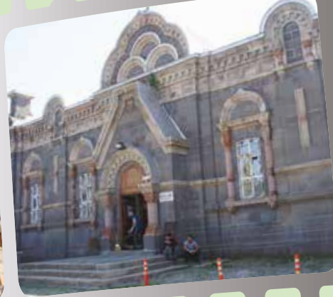
Kars Fethiye Camii (Aleksandr Nevski Askeri Kilisesi)