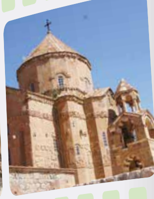
Van Akdamar Ermeni Aziz Haç Kilisesi