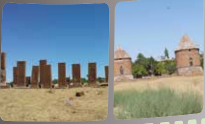
Bitlis Ahlat Mezarlığı

Uzun zamandır hayalini kurduğum (fakat çoğu zaman gerçekleşmesinin zor olduğunu düşündüğüm) ve sonunda 10.09.2017- 16.09.2017 tarihlerinde katıldığım Doğu Anadolu turunu sizlerle paylaşmak istedim. Tahmin edeceğiniz gibi bu yazdıklarımın çok daha fazlası var.